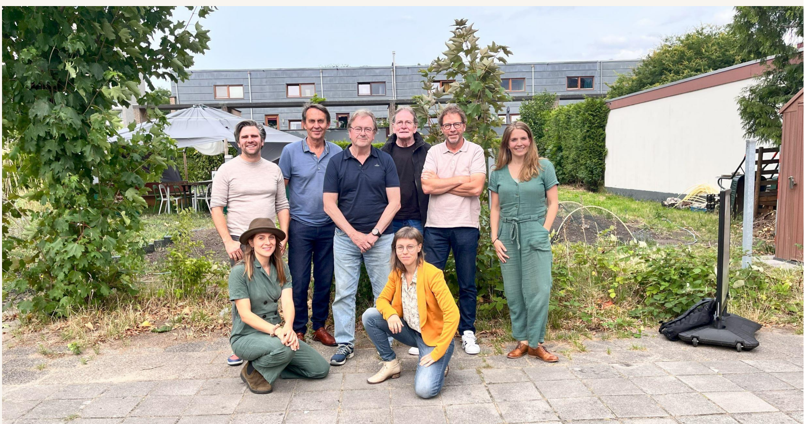
Kennismaking nieuwe bestuursleden en medewerker, Burezina

"Ik kan altijd terecht met vragen. Ze reageren snel, denken goed en praktisch mee. Ze hebben veel expertise in huis en een groot netwerk. De maandelijkse nieuwsbrief is actueel en overzichtelijk. Ze bieden zeer regelmatig workshops en informatiebijeenkomsten. Ze zorgen voor verbinding tussen de leden." - Lid over de ondersteuning van het bureau, enquête 2022