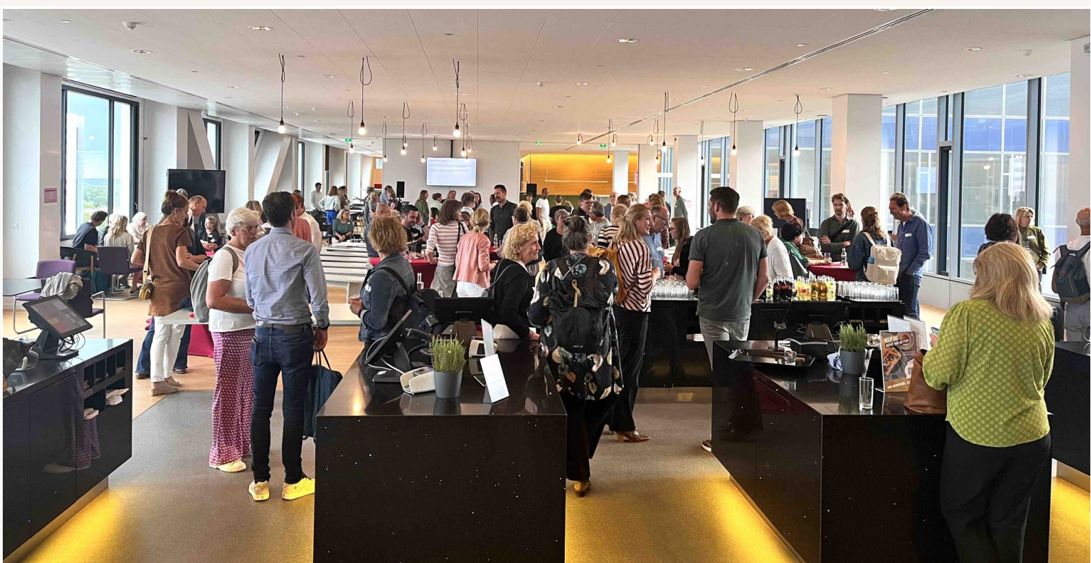
Toekomst Sociale Basis, participatiebijeenkomst gemeente Utrecht

weten te overwinnen en ze hun unieke meerwaarde creëren voor de stad. Dit overkoepelende perspectief biedt ons een visie op zelfbeheer die we inbrengen bij externe partners in het sociaal en cultureel domein, waaronder ook fondsen en de gemeente. Bijvoorbeeld door raadsleden te informeren over ons werk, door mee te praten over hoe beleid beter aan kan sluiten op de praktijk, of door te onderzoeken welke samenwerkingen er mogelijk zijn. Hiermee zetten we ons in om zelfbeheer op de kaart te zetten, ook in het beleid. Dit doen we zowel in opdracht van de leden, op eigen initiatief als op verzoek van externe partners zoals de gemeente. Uiteindelijk bepalen de leden of een aanpassing van de strategie gewenst is of welke koers het Dwarsverband vaart. Naast deze collectieve vorm van belangenbehartiging ondersteunen we ook individuele locaties waar dat past. Op dit moment voorzien we dat we in 2024 onder andere bezig zullen zijn met belangenbehartiging rondom de toenemende zorglast en druk op informele zorgorganisaties zoals de buurthuizen en speeltuinen in zelfbeheer, ontwikkelingen in de sociale basis die relevant zijn voor onze leden, de energietransitie en de zichtbaarheid van en communicatie omtrent buurtcentra in zelfbeheer vanuit de gemeente.