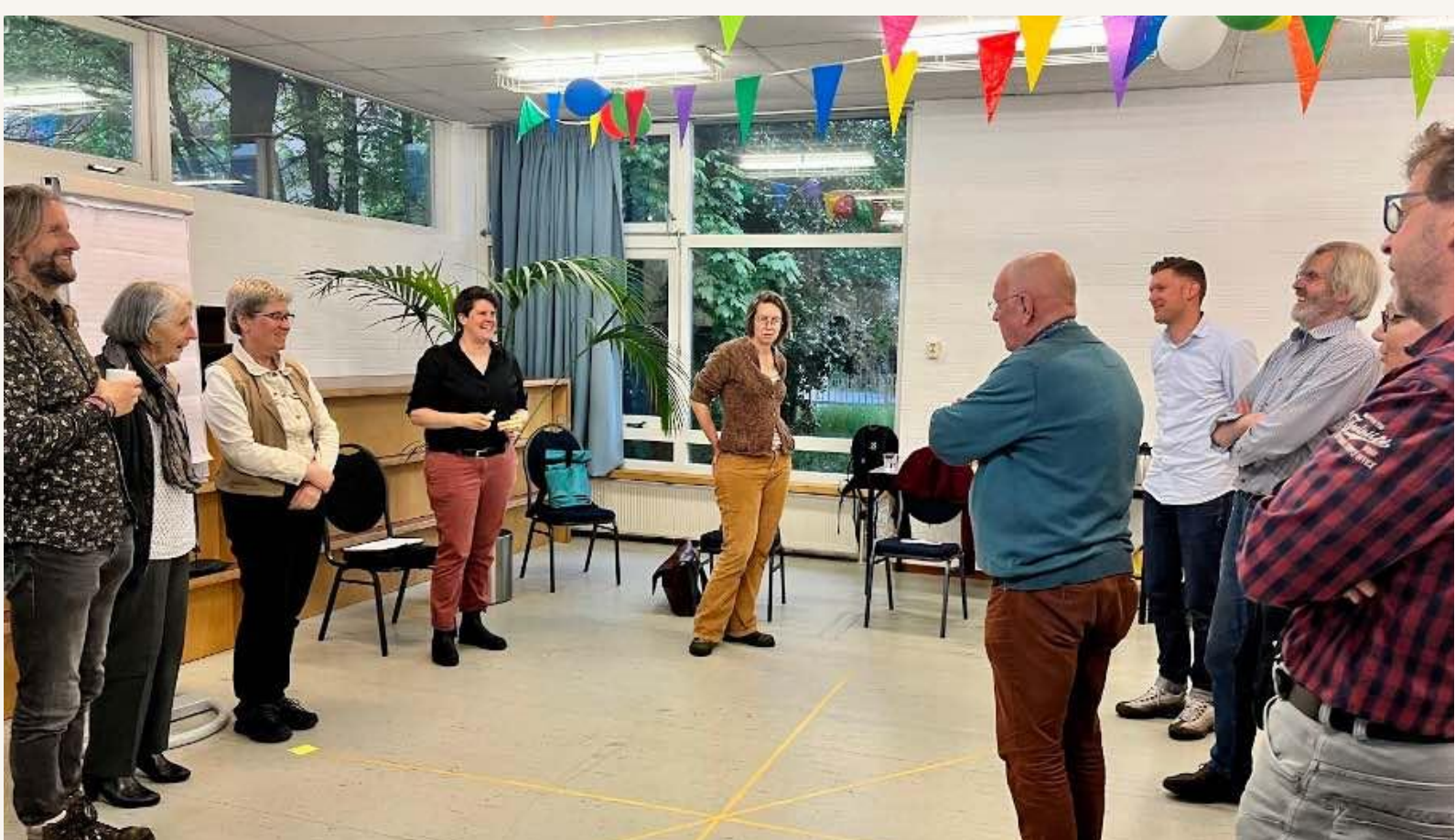
Leden tijdens de meedenksessie voor de Meerjarenvisie, Burezina

Samen staan we sterker. We verbeteren de positie van bewonersinitiatieven in zelfbeheer die een ontmoetingsplek creëren. Dit doen we aan de hand van vier werkgebieden namelijk: kennisuitwisseling, directe ondersteuning, belangenbehartiging en vernieuwing. Hierdoor kunnen bewonersinitiatieven in zelfbeheer hun eigen locatie beter besturen en beheren en bijdragen aan de sociale cohesie in buurt of wijk. Door het verenigen van individuele locaties staat het zelfbeheer sterker in het sociaal en cultureel domein.