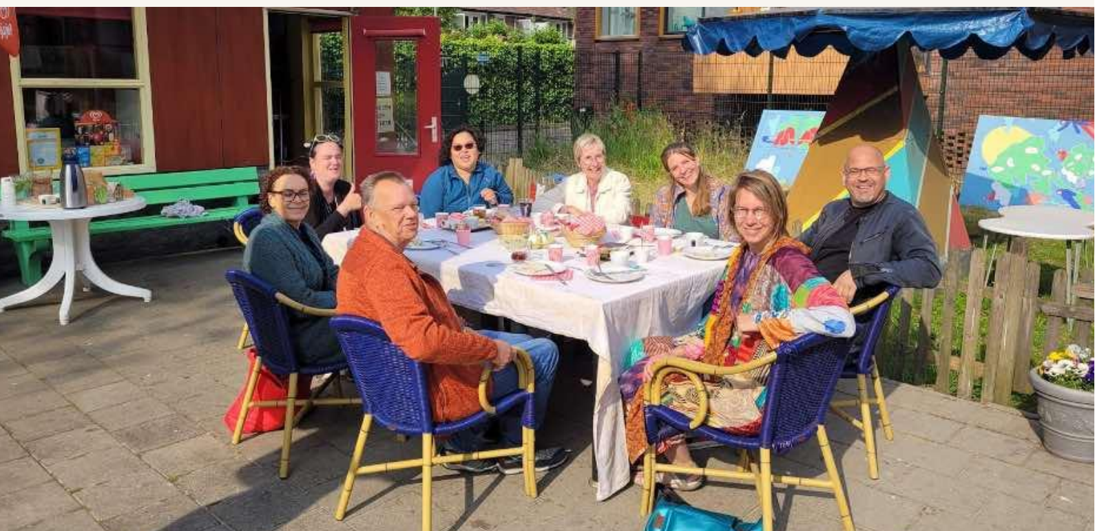
Beheerdersontbijt bij Speeltuin de Pan

speeltuinmakers (net als het beheerdersontbijt) maar ten tijde van het schrijven van dit plan is het nog te vroeg om daar concrete uitspraken over te doen. Ook houden we ruimte voor mogelijke nieuwe werkgroepen, op basis van de behoefte van de leden.