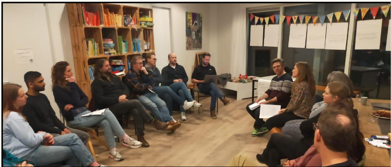
Bijeenkomst speeltuinbesturen bij natuurspeeltuin de Hoef